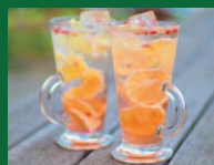
ローズレモネード