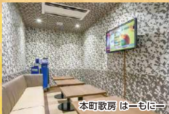
本町歌房 はーもにー